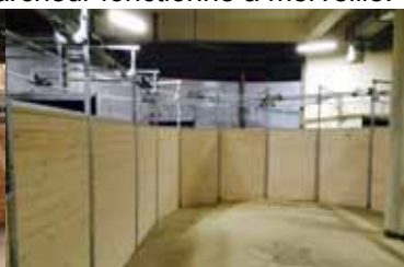
Montage russe par l'acheteur lui-même