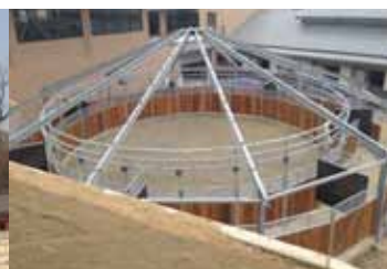
Marcheur à anneau de glissement pour Séoul !