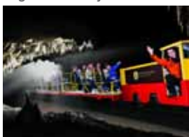
Petit train électrique dans la grotte Postojna

Nota : si vous vous rendez à Lipica, nous vous recommandons également de vous rendre dans les grottes de Postojna.