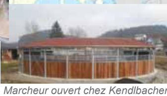
Marcheur ouvert chez Kendlbacher