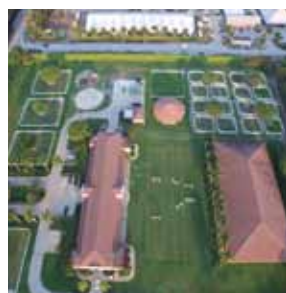
Artemis Equestrian Farm