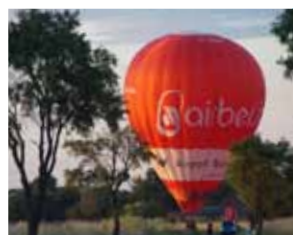
Traverser les Alpes ?

TUYAU : cette année l'école espagnole d'équitation fête ses 450 ans. Pour tous ceux ayant loupé l'occasion d'une visite lors du voyage clients pourront se rattraper à leur prochaine visite à Vienne. Il est cependant conseillé de commander des tickets à temps. Vous devrez alors à tout prix vous rendre dans la cour intérieure où se trouve un de nos plus grands marcheurs Enterprise du monde entier.