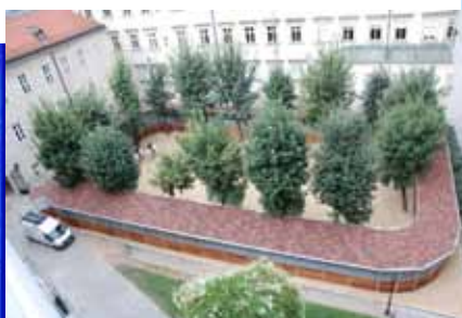
Ne passe pas inaperçu !

Et depuis peu, le terrain hippique à l'intérieur du marcheur est même couvert.