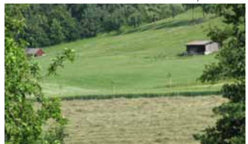
Vue sur le paradis !

en laissant les yeux bien ouverts, on y voit et découvre partout plein de belles choses intéressantes. Il commence à s'exalter en racontant : „Si, en venant du sud pour me rendre à Honhardt, je jette un regard sur notre vallée avec son paradis depuis le mont Sandberg et que je peux voir le clocher de l'église, je sais exactement que cet endroit reste pour moi le plus beau coin du monde“.