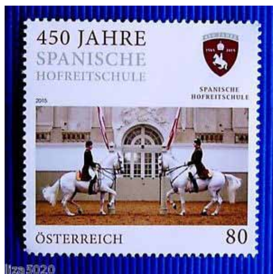
Ne pas oublier d'écrire une carte postale !