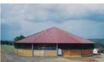
Centre de formation École espagnole d'équitation - Heidenberg

route R6 du Danube jouit d'un statut culturel parmi les cyclistes expérimentés. Des paysages variés, des villes historiques et un très bon rapport qualité-prix attendent le cycliste. Il est recommandé d'avoir un pneu de rechange dans ses bagages ;-).