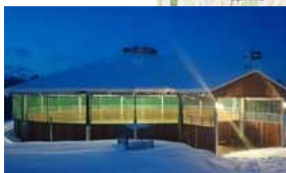
Rond de longe chez la famille Kaupp

Le lac de Starnberg s'étend également à proximité de Munich. Le haras Ammerland est situé à un endroit magnifique, au beau milieu d'un terrain défriché. Il est le berceau natal de pur-sangs de première qualité. Un marcheur cour Kraft avec rond de longe de 20,6 m s'intègre harmonieusement à l'ensemble du haras.