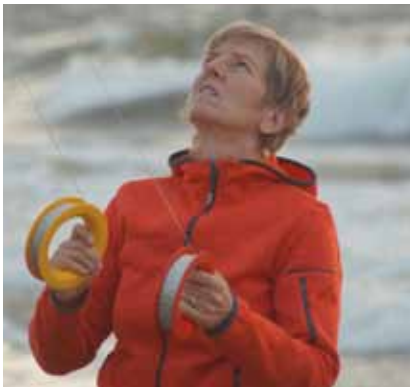
Cerfs-volants au bord de la mer Baltique