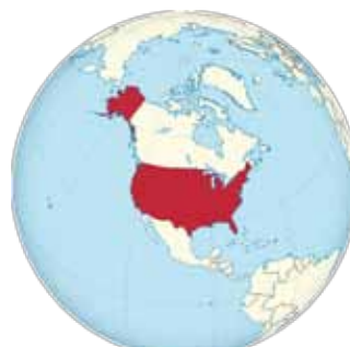
États-Unis - également potentiel élevé !

À dix minutes de la côte atlantique, il serait idiot de ne pas profiter de l'occasion pour visiter les plages claires de Palm Beach. Plein de sable, vagues, soleil Tout simplement magnifique.