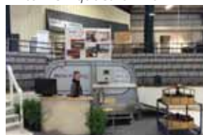
Rolex en fait également partie !

Nos marcheurs Kraft sont implantés partout où les chevaux ont leur quartier d'hivers ou d'été. La randonnée va du nord au sud ou bien de l'est vers l'ouest et comprend naturellement également le chemin du retour. De nombreux habitants de la côte Est passent l'hiver en Floride. Les conditions climatiques sont parfaites et les compétitions offertes à Wellington sont aussi nombreuses que le sable en bord de mer (;-). Notre présence avec nos partenaires Amberway et Lucas Equestrian, pendant 12 semaines par an à Wellington commence à se rentabiliser.