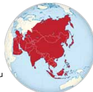
Grand potentiel pour des marcheurs Kraft en Asie !

Nous avons en plus livré un marcheur Enterprise de 10x20 m à Moscou. Instructions de montage en russe, un véritable défi. Gros compliments à l'équipe de montage. Le montage par l'acheteur lui-même a très bien fonctionné et le marcheur fonctionne à merveille.