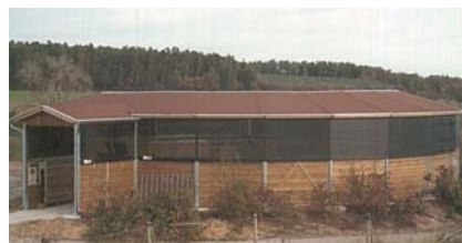
Pensionsstall Phillip, Neuhausen, (D) Hufschlagdach mit Bitumenschindeln, Vorbau und Windnetzen