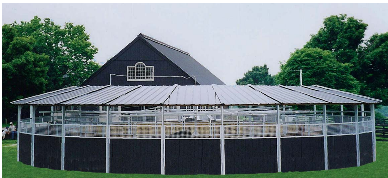
Overbrook-Farm, Lexington, Kentucky (USA). Kraft Bodenführanlage mit Hufschlagdach aus Trapezblech

Uwe Kraft Reitsportgeräte & Metallbau GmbH